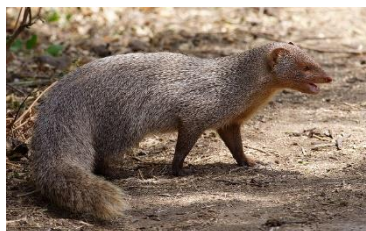
Mammal – Indian Grey Mongoose