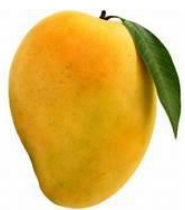
Fruit – Mango