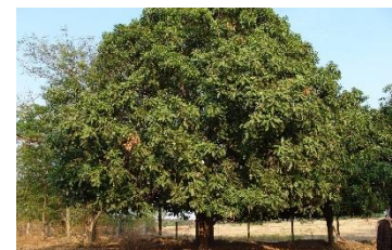
Tree – Mangi fera indica (Mango)