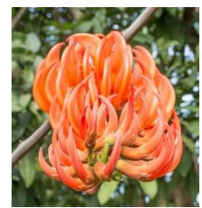
Flower – Dhaak