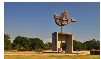
Open hand Sculpture