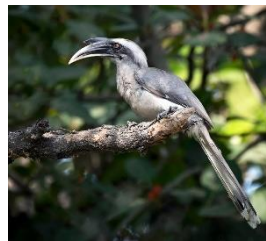
Bird – Indian Grey hornbill