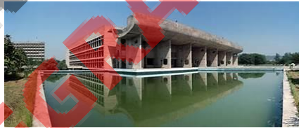
Palace of Assembly